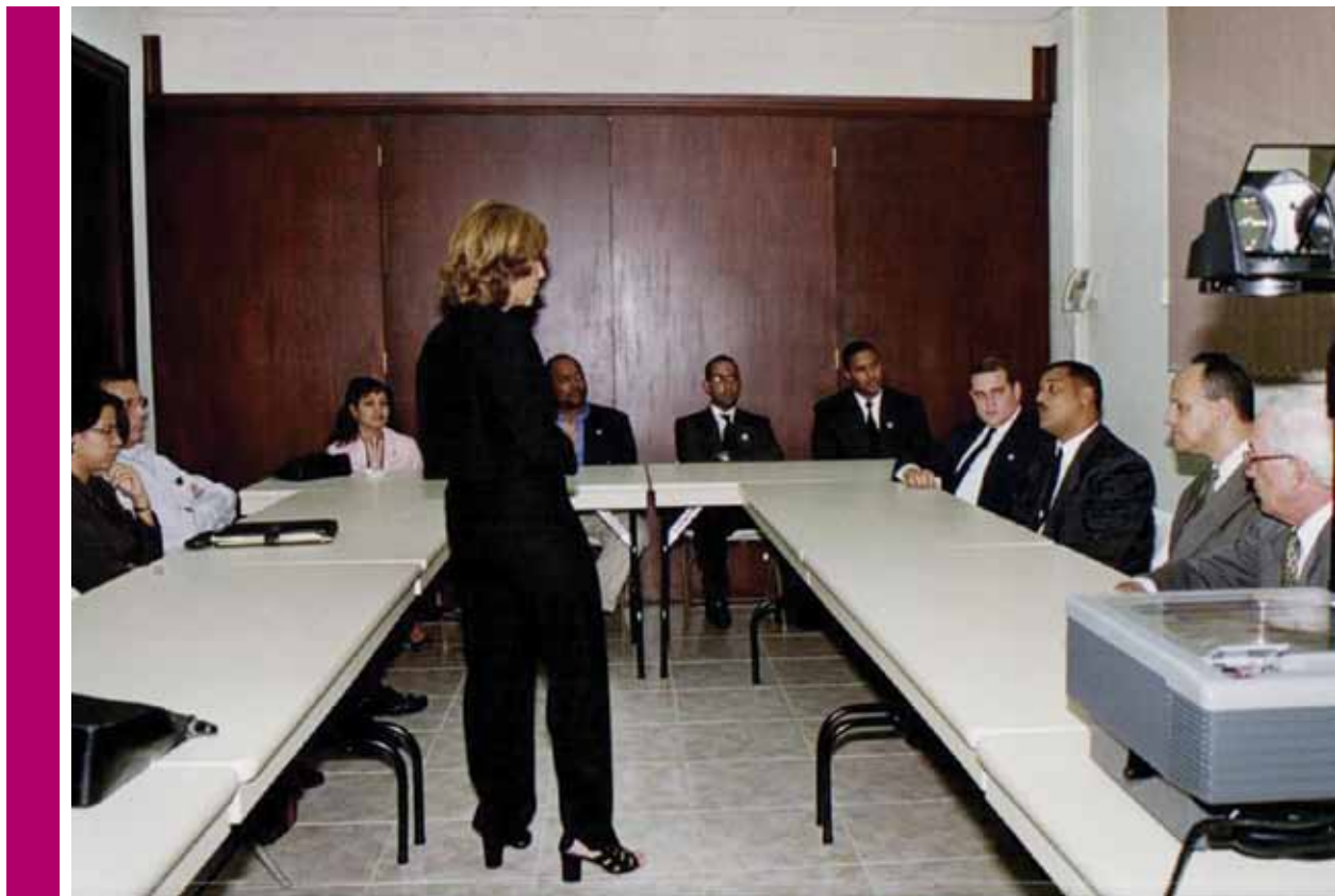
Taller Resolución Alternativa de Disputa 1999 en la ENJ.

fue Civil del 100% de mediaciones sorteadas solamente el 35% se transforma en expediente judicial, el restante 65% no deriva a juicio. En los juicios por daños y perjuicios derivados de accidentes de tránsito con seguro automotor, alrededor de un 90% se trata por mediación con un 60% de acuerdos y sólo un 11% de las mediaciones sin acuerdo pasó a juicio. En cuanto al índice de litigiosidad, tomando como línea de base el año anterior a la entrada en vigencia de la ley de mediación prejudicial obligatoria, se nota una disminución en el porcentaje de inicio de juicio en las materias incluidas en la ley, en especial cabe mencionar los daños y perjuicios, y las cuestiones de familia, régimen de visitas, tenencia, alimentos, entre otros. Finalmente cabe mencionar que ha podido medirse la ampliación del acceso a justicia y en los tribunales nacionales se incrementó en un 35%, mientras que los de la provincia de Río Negro, alcanzó a un 104%.