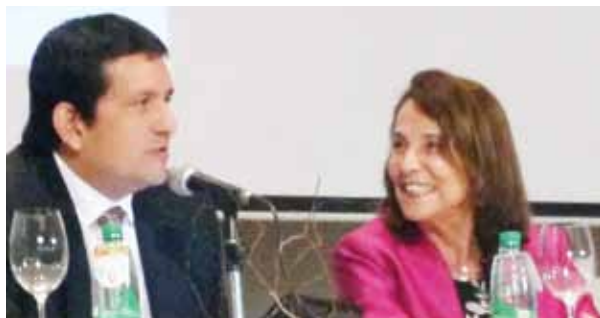
Encuentro regional de mujeres juezas de América Latina y El Caribe.

Sj Algunos doctrinarios han considerado que específicamente la mediación es una especie de justicia privada o sustituto del litigio jurisdiccional, en tanto no está judicializada. Entonces, ¿podemos decir que la mediación le da preponderancia a lo justo sobre lo legal o es lo contrario?