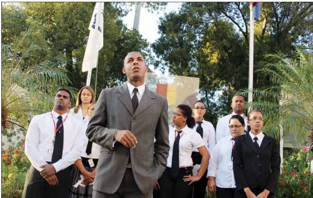
Grupo de Aspirantes a Juez de Paz del grupo 1-2012 realizando un acto con motivo a la Independencia Nacional.