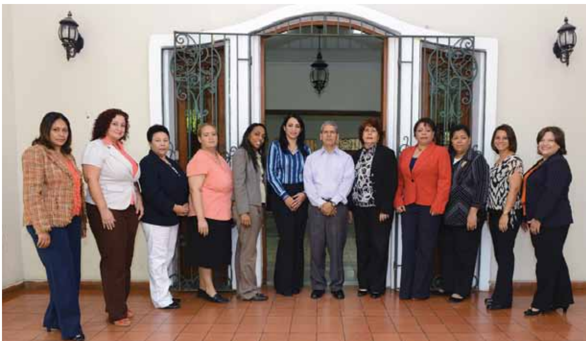
Equipo técnico del CEMEFA.

En el Centro, diez profesionales multidisciplinarios ofrecen el servicio de mediación a través de las casas comunitarias ubicadas en el sector de Gazcue