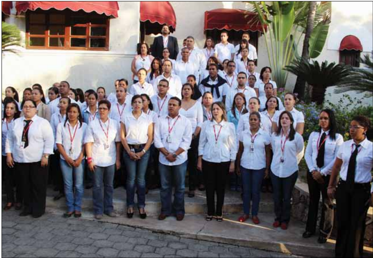
Empleados y estudiantes de la Escuela entonando el himno nacional.