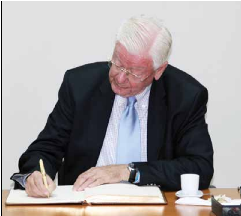
El destacado jurista alemán Claus Roxin firmando el libro de visitantes distinguidos de la Escuela.