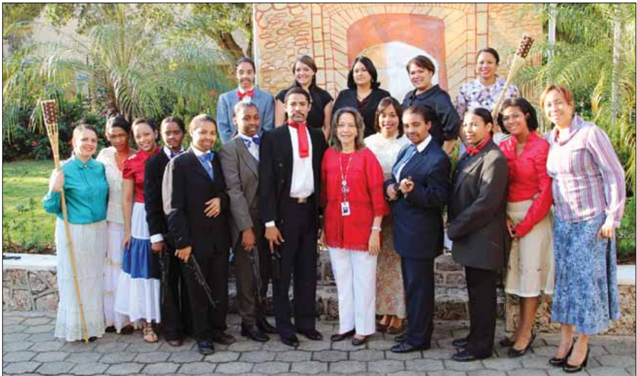
Aspirantes a juez de paz del grupo 2-2012 junto a la dirección de la Escuela en un acto conmemorativo al 169 aniversario Independencia Nacional.