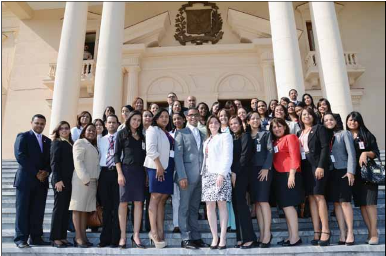
Aspirantes a jueces de paz y empleados de la ENJ en visita al Palacio Nacional con motivo a la semana de integración cultural de la Escuela.