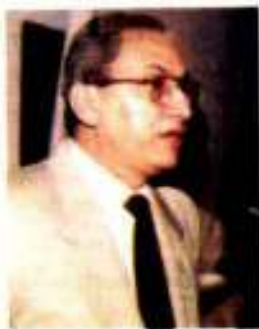
Dr. Jorge A. Subero Isa

Muchas gracias a todos y sean bienvenidos.