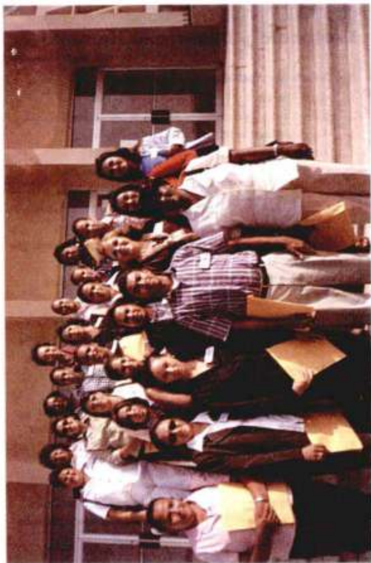
Participantes e Instructora del curso "Protocolo y Desarrollo Humano" del Departamento Judicial de Montevideo. Julio 2000