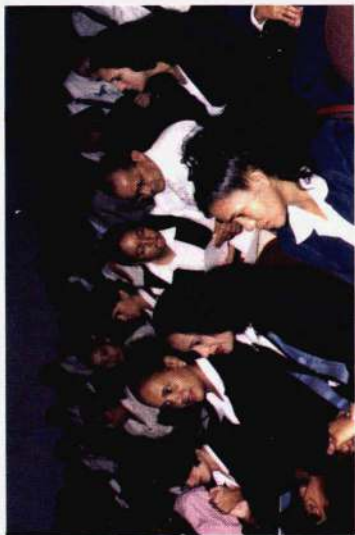
Parte del público asistente a los actos de clausura, entrega de certificados y puesta en Circulación del Libro "Cursos de Capacitación 1999" Tomo II. Auditorium de la Universidad Central del Este (UCE), 8/Diciembre/2000