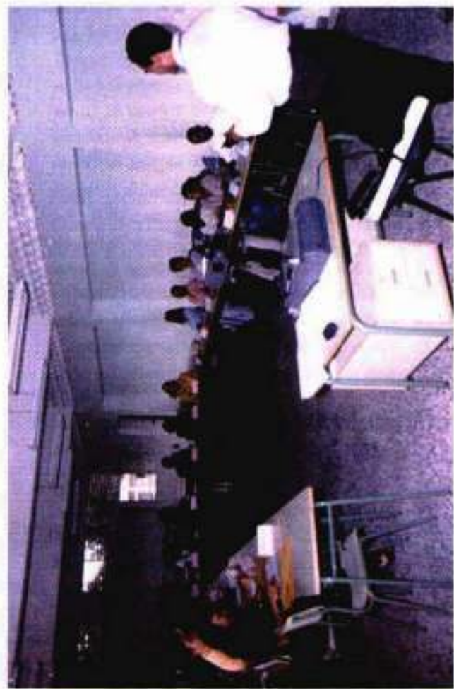
Momento de dar inicio al curso sobre "Relaciones Humanas y Caridad en la Atención al Público" a Servidores Judiciales del Depto. Judicial de San Juan de la Maguama - Junio/2000