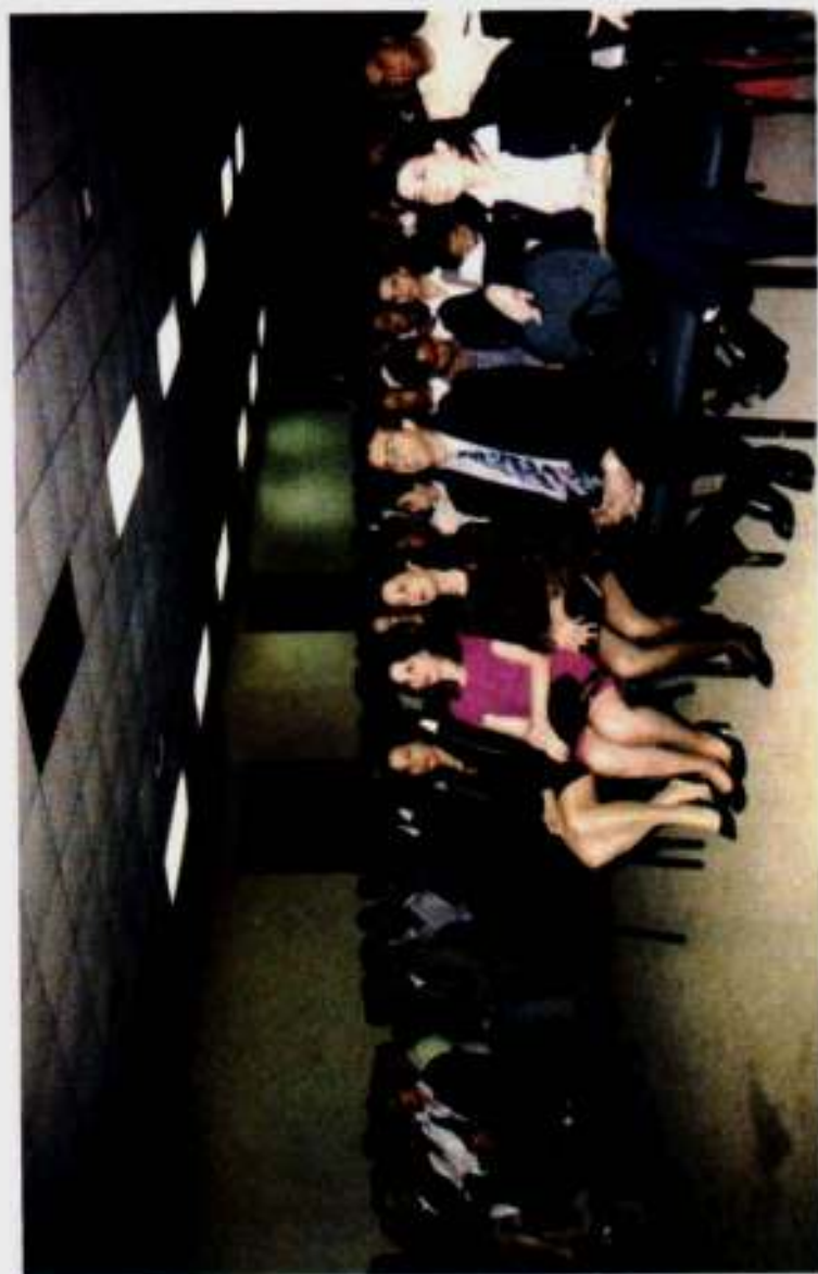
Parte del público asistente al acto de clausura y entrega de certificados de los cursos impartidos para el Depto. Judicial de Santo Domingo. Centro de Eventos. Diciembre 2000