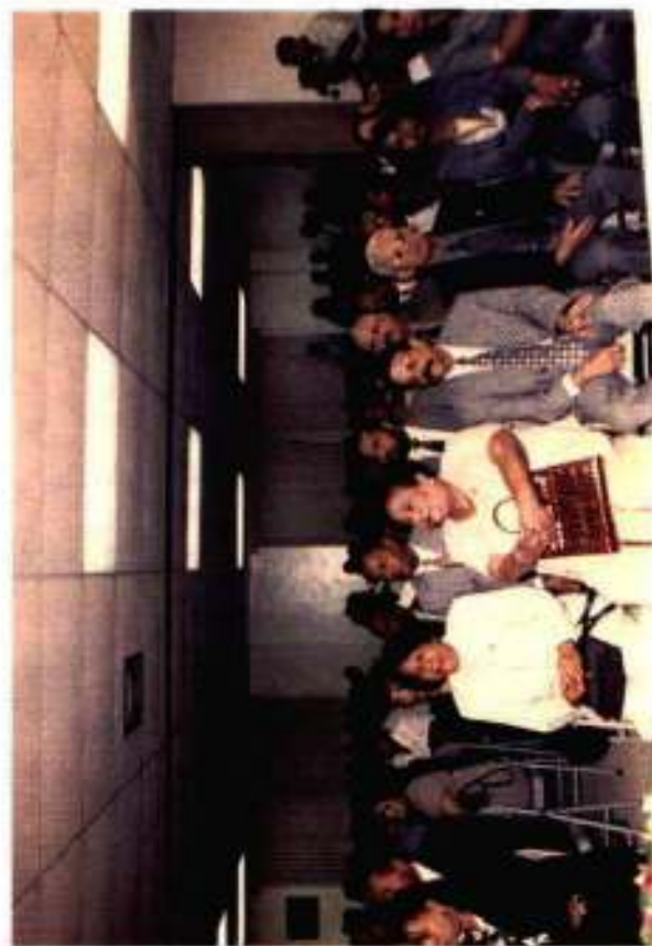
Parte del público asistente al acto de clausura y entrega de certificados de los cursos impartidos en los distintos Deptos. Judiciales de la Región Sur del país. Auditorium Regional Sur INFOTEP-Azua. 15/diciembre/2000.