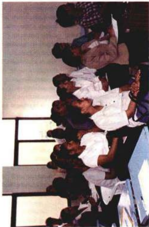
Parte de los participantes en curso "Ortografía y Redacción" impartido a empleados del Distrito Judicial de San José de Ocoa. Sept. 2000.