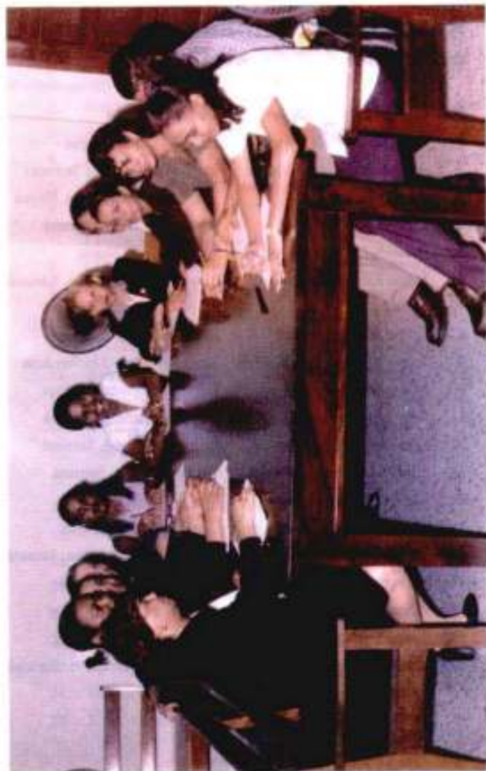
Participantes en curso "Técnica de Expresión Oral" (Oratoria) impartidos en San Francisco de Macorís. Septiembre/2000.