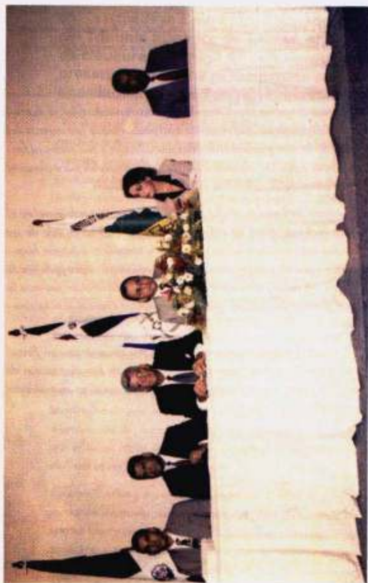
Integrantes de la Mesa de Honor en los Actos de Clausura y Entrega de Certificados. Centro de Eventos y Exposiciones, Diciembre del 2000.