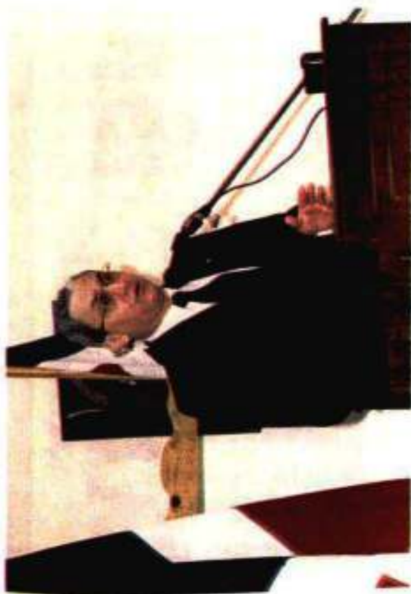
El Magistrado Presidente de la Suprema Corte de Justicia Dr. Jorge A. Subero Isa mientras pronunciaba el discurso central en los actos de clausura y entrega de diplomas. Auditorium Regional Sur INFOTEP-Azuá. 15/diciembre/2000