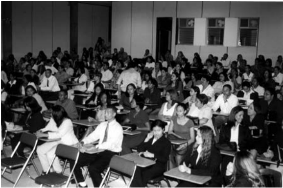
Arriba, mesa del Presidium de los actos de clausura y entrega de certificados. Abajo, parte de los asistentes. Auditorium de la Pontificia Universidad Católica Madre y Maestra de Santiago. 13/Dic./03.