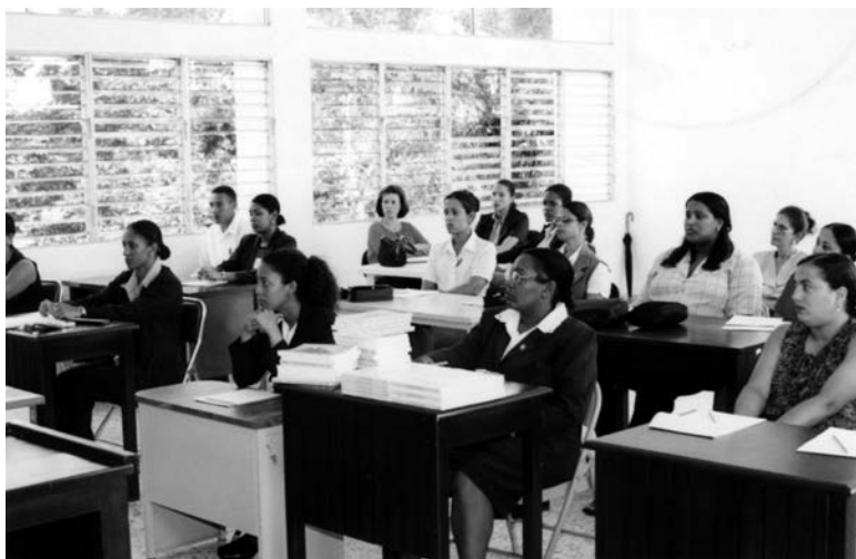
Participantes en el curso de Ortografía, impartido en la ciudad de Cotuí, República Dominicana, el 31 de agosto del año 2002.