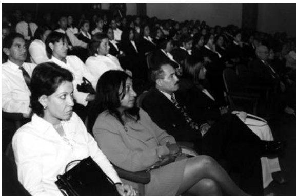
Arriba, momentos en que la Magistrada Enilda Reyes Pérez pronunciaba el discurso central en los actos de clausura, entrega de certificados y puesta en circulación del libro "Cursos de Capacitación Año 2001". Abajo, parte del público asistente. Auditorium de la Universidad Central del Este. San Pedro de Macorís. 22/Nov./2002.