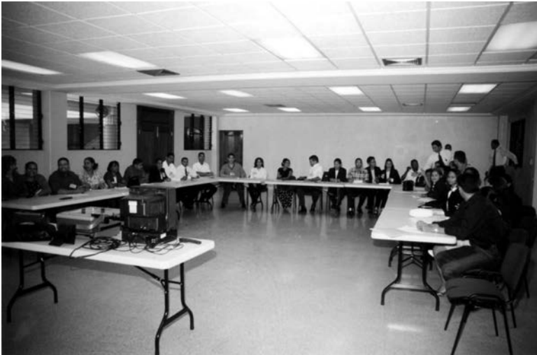
Participantes en el curso "Inducción al Servicio Judicial" Impartido en el Palacio de Justicia de Santiago. 8/marzo/02.